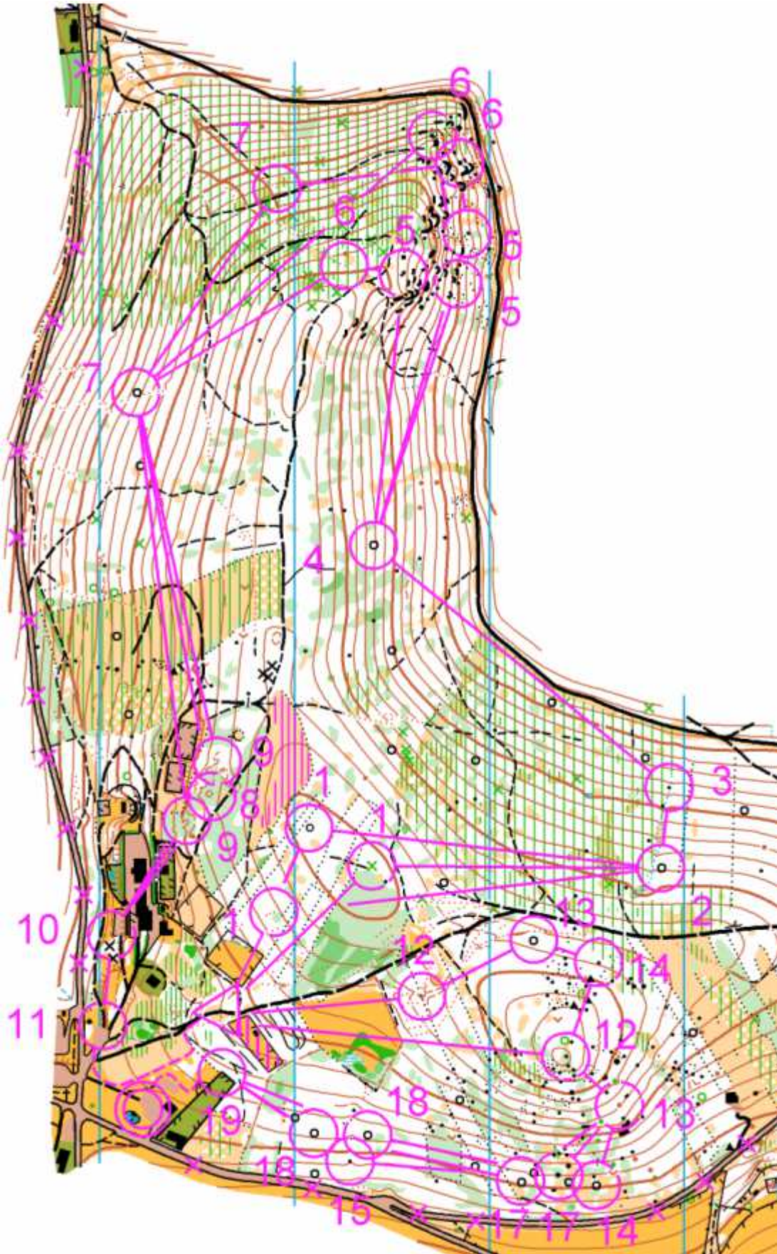
Exemple de carte (tous postes) d'un circuit à 3 boucles

Aucun orienteur du même club n'aura la même combinaison : équité oblige. Le premier orienteur franchissant la ligne d'arrivée est déclaré vainqueur. La suite du classement est établie dans l'ordre de passage de la ligne d'arrivée des autres orienteurs.