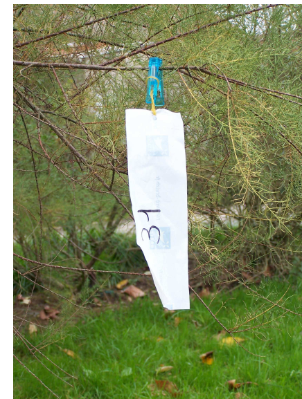
Poste : rubalise avec numéro