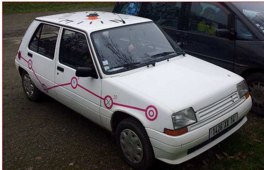
Sûrement la voiture d'un p'tit gars qui aime la CO !!!